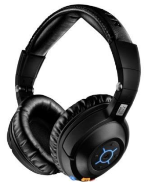
全封闭数字无线耳机